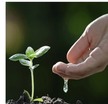
Cochrane Interactive Learning

On this page: Databases | Featured content | Editor in Chief and Editorial Board | Committees | Editorial & publishing staff | Access | History of the Cochrane Library